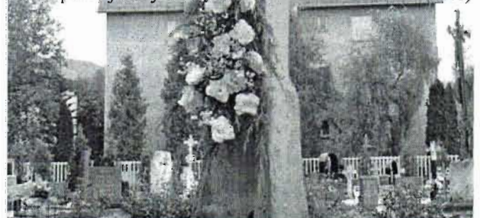
Na starom cintoríne

„Bože, milostivo príjmi túto obeť, ktorú ti predkladáme my, tvoji služobníci i celá tvoja ródina. Spravuj naše dni vo svojom pokoji, zachráň nás od večného zatratenia a pripočítaj k zástupu svojich vyvolených.“ (KKC)